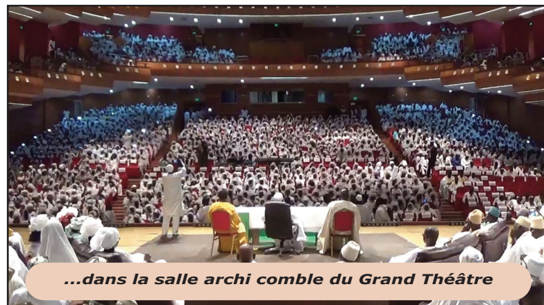
...dans la salle archi comble du Grand Théâtre