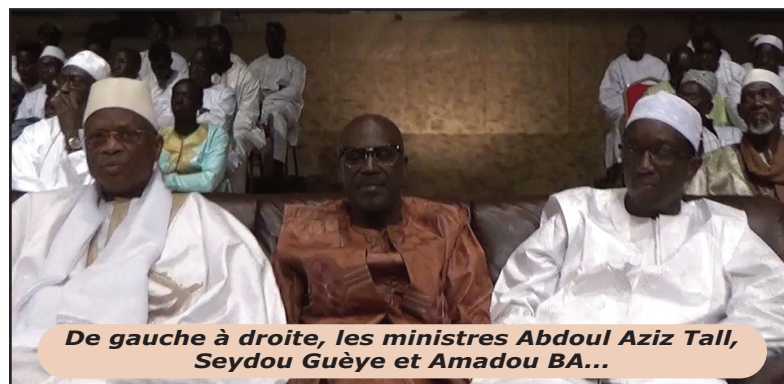
De gauche à droite, les ministres Abdoul Aziz Tall, Seydou Guèye et Amadou BA...